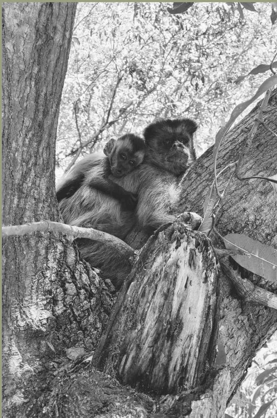
Patrícia e seu sobrinho, Alecrim. Gilbuês/PI.